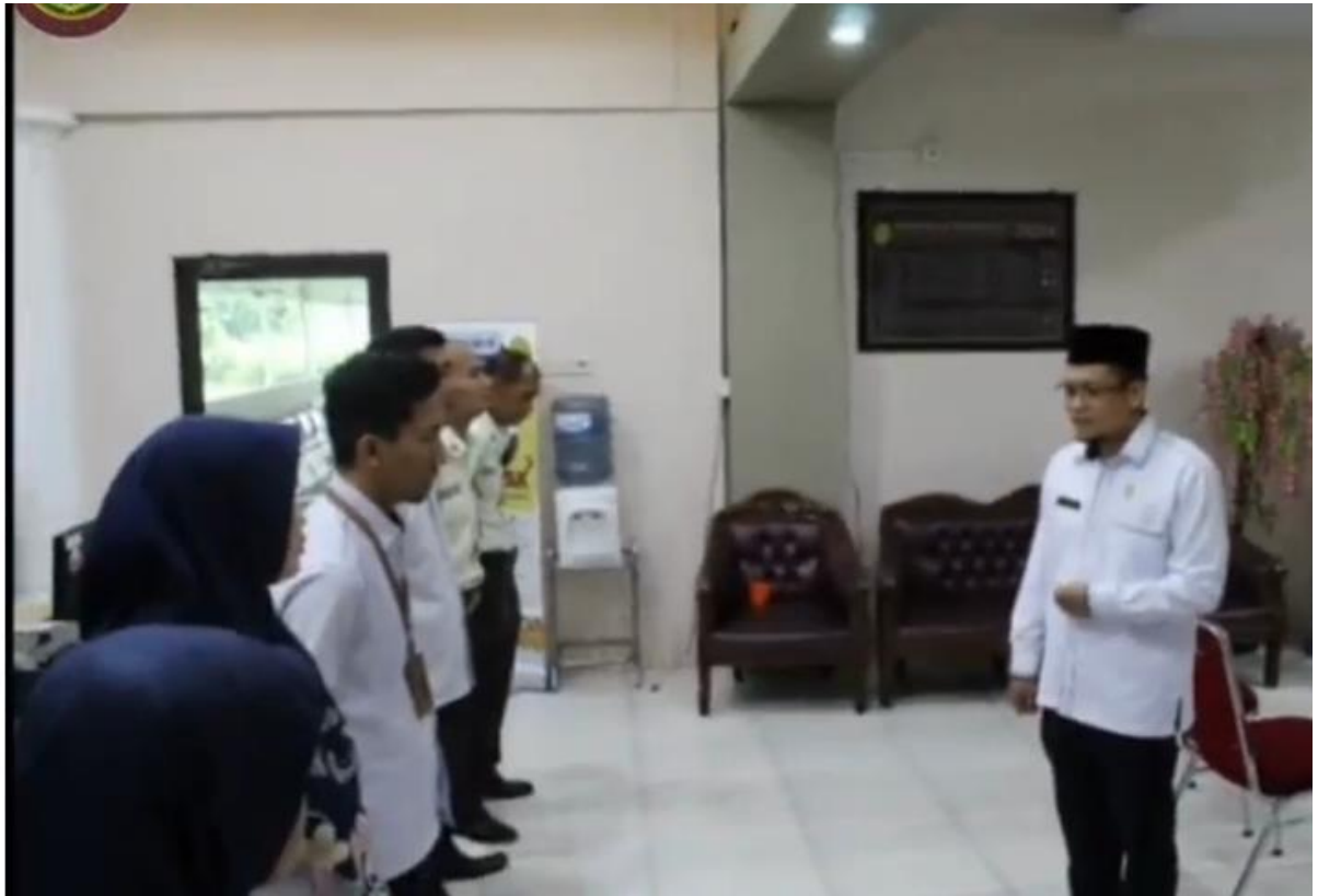
Eviden 3. Sudah dilaksanakan pembinaan melalui briefing mingguan PA Sengeti tanggal 05 Juni 2023