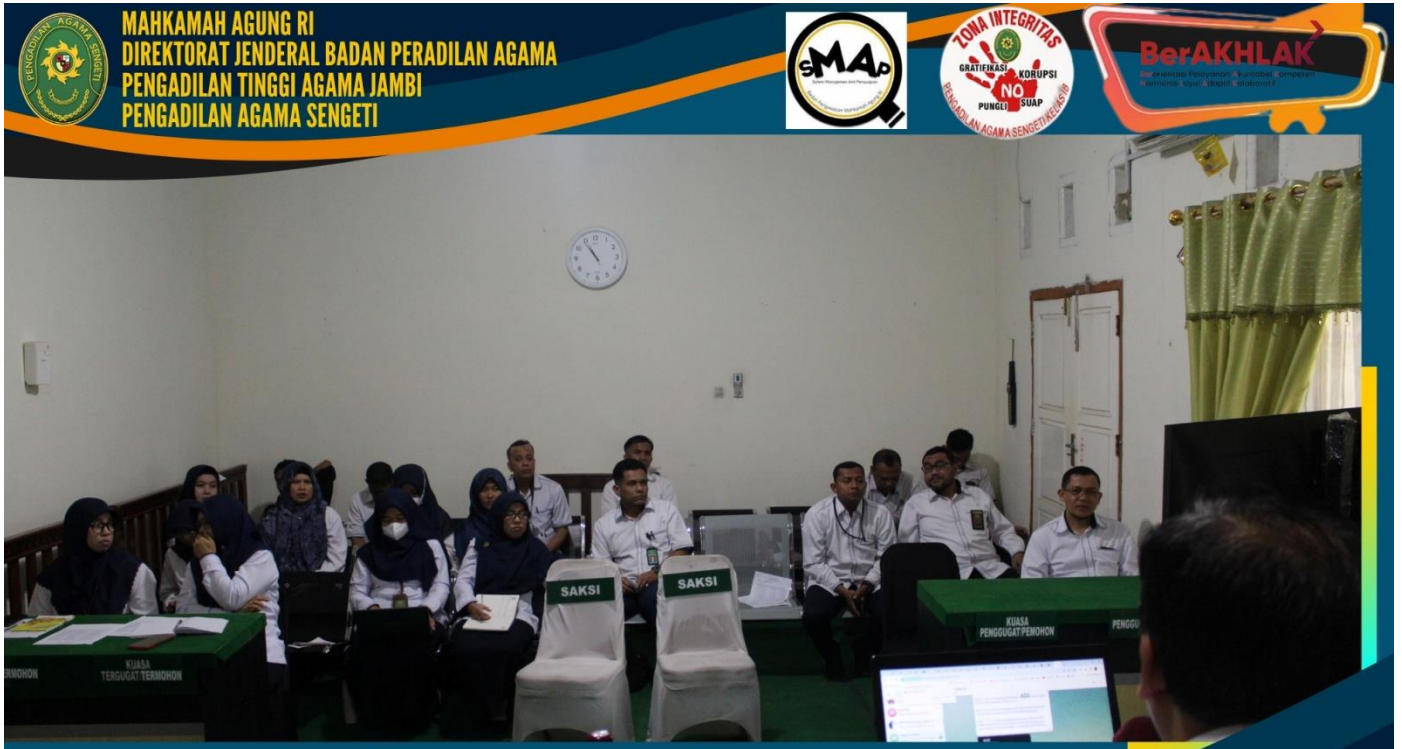
FOTO SOSIALISASI SPIP